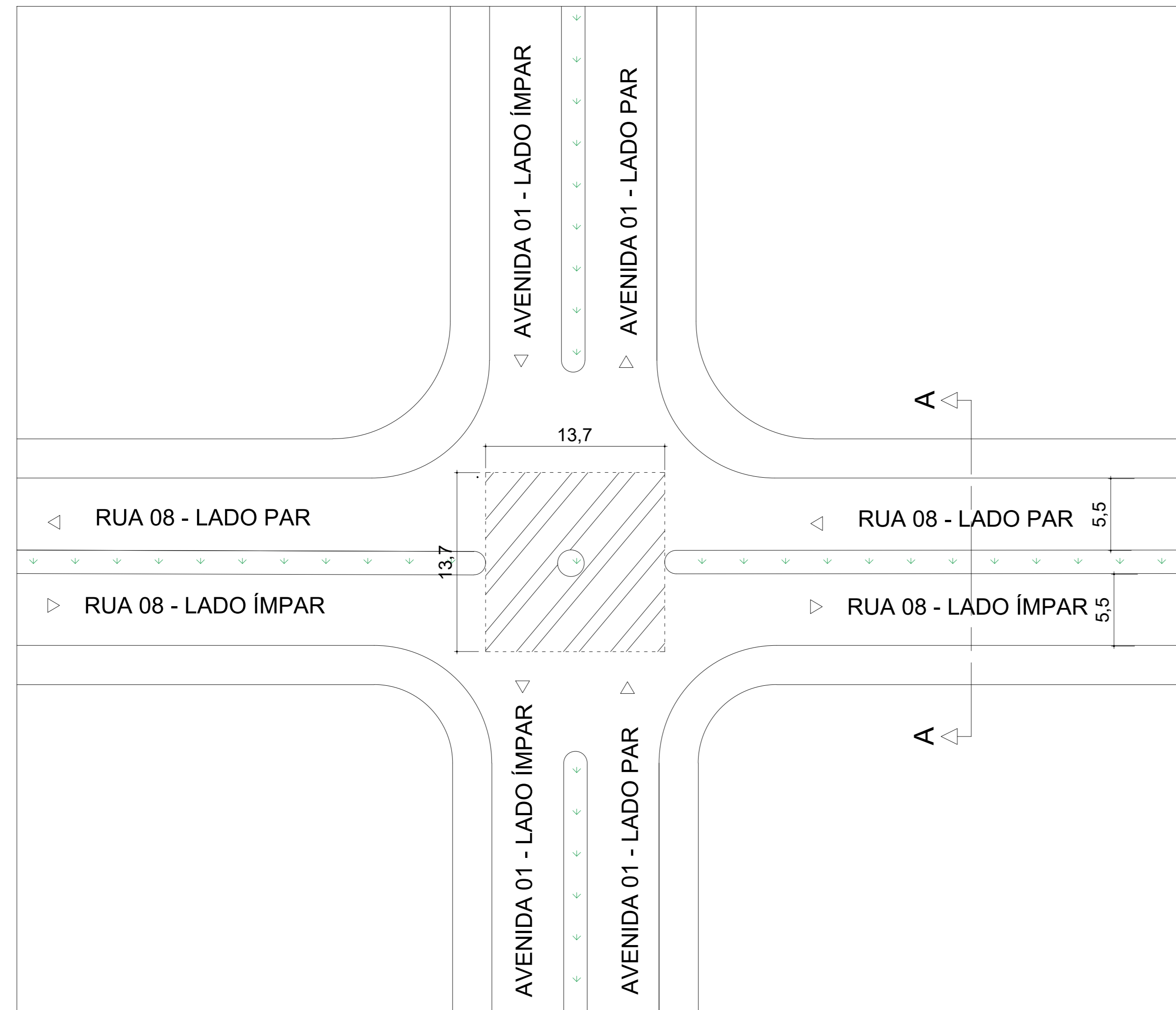
01. PLANTA DE SITUAÇÃO ESC: 1/1000