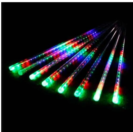
Tubo LED Colorido (Postes Rua 1)

Instalação de 4.500 metros de mangueiras de Led, com no mínimo 28 leds por metro, na cor branca, com acabamento blindado à prova d'água, por toda a extensão entre a Avenida Marginal Direita até a Avenida do Café. Instalação de 36 tubos de no mínimo 1,00 metro e 36 tubos de no mínimo 0,60 metro com efeito “gota de luz”, sendo instalados nos braços dos postes.