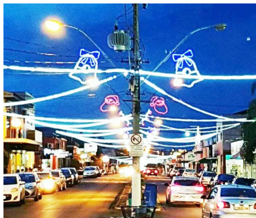
Mangueira de LED (Rua 1)

Instalação de 4.500 metros de mangueiras de Led, com no mínimo 28 leds por metro, na cor branca, com acabamento blindado à prova d'água, por toda a extensão entre a Avenida Marginal Direita até a Avenida do Café. Instalação de 36 tubos de no mínimo 1,00 metro e 36 tubos de no mínimo 0,60 metro com efeito “gota de luz”, sendo instalados nos braços dos postes.