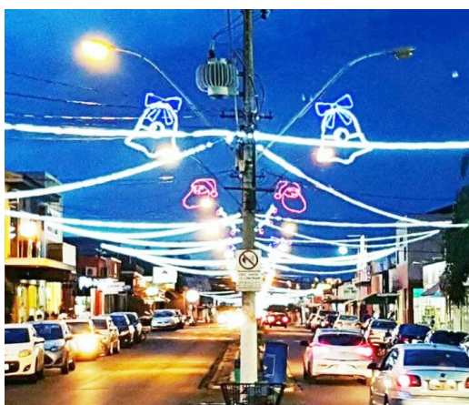
Mangueira de LED (Rua 1)

Instalação de 4.500 metros de mangueiras de Led, com no mínimo 28 leds por metro, na cor branca, com acabamento blindado à prova d'água, por toda a extensão entre a Avenida Marginal Direita até a Avenida do Café. Instalação de 36 tubos de no mínimo 1,00 metro e 36 tubos de no mínimo 0,60 metro com efeito “gota de luz”, sendo instalados nos braços dos postes.