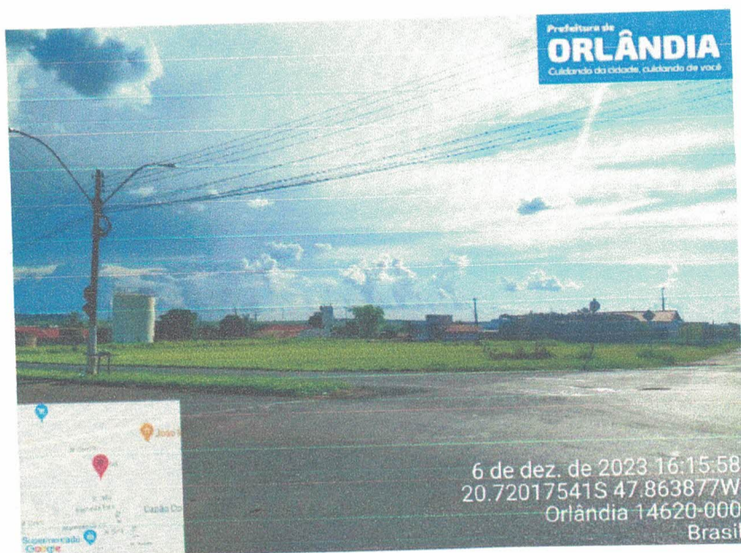
Figura 1 - ACESSO A QUADRA 92/49

O acesso ao local se dá pelas vias existentes locais, Avenida P e Avenida Q e pela Rua 1.